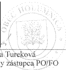
Jana Tureková štatutárny zástupca PO/FO